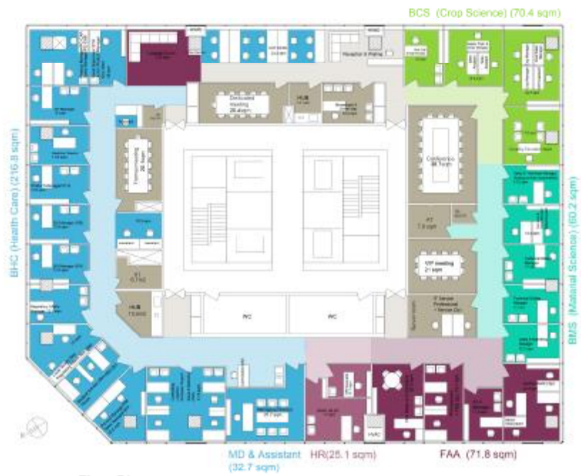
Floor Plan sc 1:150