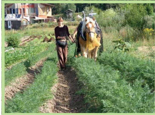
عکس ۳- مزرعه بیولوژیک در اکودهکده زیبن لیندن، آلمان

اجتماعی، اقتصادی، بوم‌شناختی و فرهنگی - معنوی را در بر می‌گیرند. آنها تجربه ایجاد اجتماع‌های محلی پایدار را مورد آزمون قرار داده و جنبه‌های گوناگونی از طراحی اکولوژیک از قبیل طراحی و ساخت اکو، استفاده از انرژی‌های جایگزین، تولید یا فرآوری همساز با طبیعت، و اصول پرماکالچر (کشاورزی طراحی شده برای سازگاری با طبیعت و تهیه غذا، سلولز و سوخت برای جامعه) را به کار می‌گیرند. اکودهکده‌ها معمولاً بر کشاورزی ارگانیک، پرماکالچر و دیگر رویکردهایی که عملکرد اکوسیستم‌ها و تنوع زیستی را ارتقا می‌دهند، متکی هستند. طرفداران اکودهکده‌ها همچنین جستجوگر و مروج سبک زندگی پایدار و سادگی داوطلبانه با حداقل مبادله بازرگانی، آن هم با منطقه محلی یا ناحیه اکو، و دوری از زندگی مصرفی و کلیشه‌ای هستند.