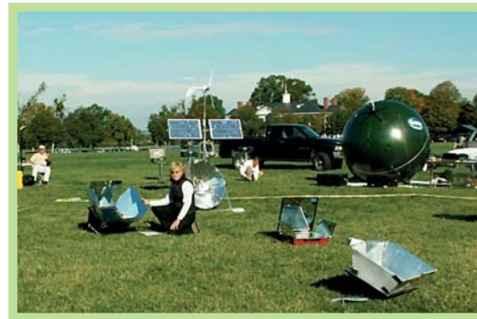
عکس ۹- آزمایش میدانی برای دهکده خورشیدی در اکودهکده تامرا، پرتغال