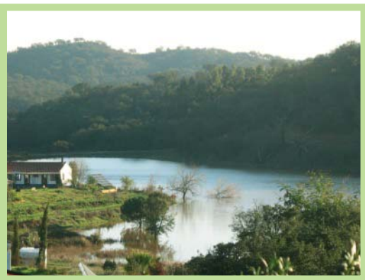
عکس ۱- منظره عمومی اکودهکده تامرا با دریاچه مصنوعی، پرتغال

این ابعاد نیز حیاتی است. در این رویکرد به توان جوامع انسانی برای گردهم آمدن و طراحی مشترک مسیر به سوی آینده به عنوان یک نیروی محرک اصلی برای تغییرات مثبت نگریسته می شود.