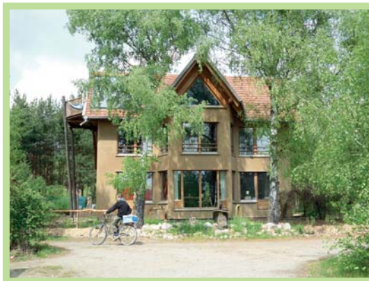
عکس ۴- نمای معماری بومی از کاهگل و چوب در اکودهکده

مهم‌ترین خصوصیات اکودهکده‌ها برابر نظر "جاناتان