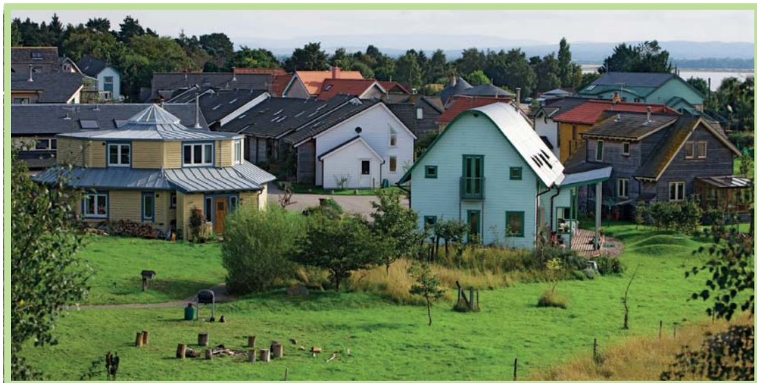
عکس ۲- منظره واحد همسایگی در اکودهکده فیندهورن، اسکانلند

"بازگشت به جامعه" صورت اولیه و خام پاسخ امروزی اکودهکده‌ها بودند. در این حال، در بهار سال ۱۹۸۳ روبرت گیلمان، فیزیک‌اخترشناس و سردبیر "فصلنامه فرهنگ انسانی پایدار" در اولین شماره آن مقصد نهایی فصلنامه را اشاعه "ده نشینی در کره خاکی" معرفی کرد. این آغازی بود بر ترویج سبک زندگی ده نشینی در دنیای مدرن و شهری شده امروز. در سال ۱۹۸۷ "بنیاد گایا" به عنوان یک انجمن خیریه توسط دو شهروند دانمارکی، راس و هیلدور جکسون تأسیس و وقف آموزش توسعه پایدار شد. آنها بر این باور بودند که دنیا، در جامعه‌ای پیشرفته از لحاظ فن‌آوری، بیش از هر چیز به نمونه‌های مناسبی از معنای زندگی سازگار با طبیعت در مسیری پایدار و ارض‌کننده از نظر معنوی احتیاج دارد. در سال ۱۹۹۱ روبرت و دایان گیلمن از طرف بنیاد گایا مامور شدند تا سمیناری