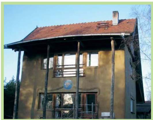
عکس ۶- نمونه معماری بومی از کاه گل و چوب در زمین لیندن، آلمان

قادر به مشارکت در اتخاذ تصمیم‌هایی می‌شوند که مستقیماً بر زندگی آنها و سرنوشت اجتماع تأثیر دارد.