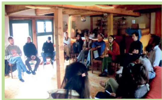
عکس ۸- جمع فرهنگی - معنوی با محوریت مسائل انسانی در یک اکودهکده