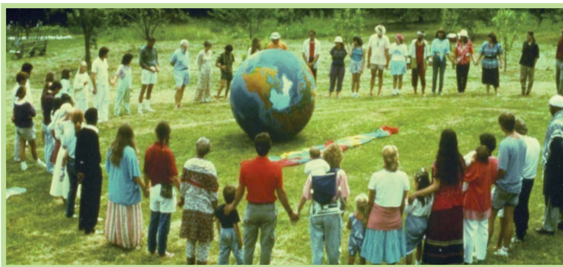
عکس ۱۱- جشن زندگی در اکوده‌هکده زگ، آلمان

اکوده‌هکده آزمایشگاه زندگی برای ایجاد جامعه‌ای عادلانه و شایسته بر پایه تشریک مساعی و درک متقابل است. جنبش اکوده‌هکده‌ها برخی از مهم‌ترین سازوکارها، دانش و آموزش لازم برای گذار به آینده‌ای پایدار را فراهم می‌کند. به این ترتیب اکوده‌هکده‌ها نوعی آزمونگاه و در عین حال آموزشگاه عملی و نظری زیست پایدار هستند که چگونگی تحول به سوی پایداری