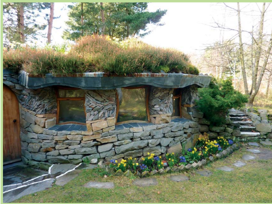
عکس ۷- معماری متأثر از طبیعت در اکودهکده فیندهورن، اسکاتلند