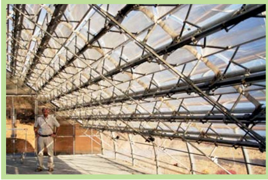
عکس ۱۰- سیستم یکپارچه پانل های خورشیدی در اکودهکده تامرا، پرتغال

اتلاف کمتر از آنچه که فرد به کره خاکی می دهد، به صورتی آگاهانه در جهت کاهش چشمگیر رد پای بوم شناختی خود گام بر می دارند. معمولاً در جوامع توسعه یافته رد پای بوم شناختی اکودهکده ها بین ۳۰ تا ۵۰ درصد متوسط رد پای اکولوژیک هر کشور است.