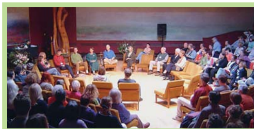
عکس ۵- جلسه عمومی هم‌فکری و تصمیم‌گیری مشارکتی در اکودهکده فیندهورن، اسکاتلند

اکودهکده‌ها اجتماع‌هایی هستند که در آنها فرد احساس حمایت از طرف دیگران و مسؤلیت نسبت به اطرافیان خود دارد. آنها حسی عمیق از تعلق گروهی را ایجاد می‌کنند و به آن اندازه کوچک هستند که فرد بتواند احساس امنیت، حمایت، دیدن و شنیدن داشته باشد. به این ترتیب افراد به صورتی شفاف