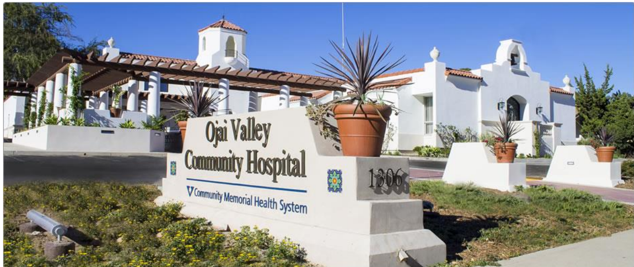
بیمارستان دره اوهای ساخت 1960

مصرف انرژی و آب تنها ملاکهای ارزیابی میزان پایداری شهر به شمار نمی روند. کنت پورتنی (Kent Portney) که سالها روی مقایسه پایداری شهرهای امریکایی تحقیق کرده است می گوید: "شهرهایی که پایداری را به طور جدی دنبال می کنند، معمولاً طیف گسترده ای از فعالیت هایی که مستقیماً برای بهبود و یا حفاظت از محیط زیست است را انجام می دهند و این کار به طور غیر مستقیم بر مصرف انرژی موثر خواهد بود." پورتنی ضمن تحقیقات خود دریافته است که نه جمعیت شهر، نه اندازه آن، و نه درآمد متوسط ساکنان و شهر عوامل تعیین کننده در توسعه پایدار شهرند. او سه عامل را در این رابطه تعیین کننده می داند: شهروندان خلاق، سازمانها و گروههای طرفدار محیط زیست، و رهبران شهری. اوهای هر سه این عوامل را دارا بوده است که بتواند به طرف توسعه پایدار گام بردارد. شهر کوهستانی که در انتهای یک راه بن بست قرار گرفته است، از همه جشنواره های ملی و محلی مدد می جوید تا توریست را به آنجا بکشاند و صنعت محلی را حمایت می کند تا بیشترین درآمد را از این توریستها کسب کند.