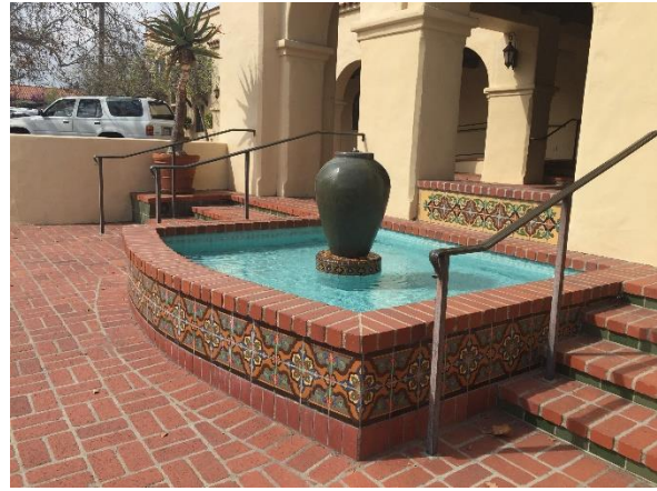
آبنما و ورودی هتل در خیابان اصلی