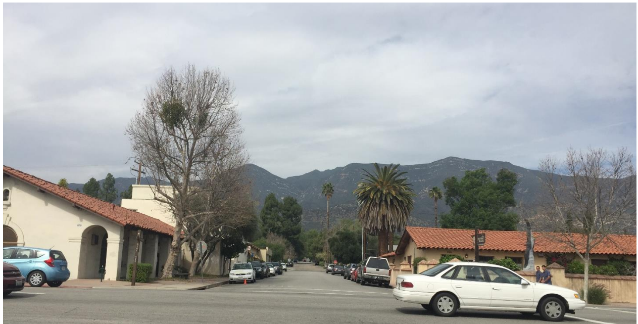
چشم انداز مناطق بالای شهر از خیابان اصلی و مرکز شهر

لیبی به دنبال معماری می گشت که ایده های او را به منصفه ظهور برساند. او هم از شیفتگان نوزایی سبک معماری مستعمره ای اسپانیایی بود که در کالیفرنیا شکل گرفته بود و در نقاط دیگر امریکا با حس نوستالژیکی تقلید می شد. اولین بنای ساخته شده بعد از گردهمایی 1914، سالن نمایشی در خیابان اصلی بود که از همین سبک پیروی می کرد و بنا بعد از بیش از یک قرن همچنان پابرجاست. در اگوست 1914 برای اولین بار فیلم "دره ماه" بر اساس داستانی از جک لندن در این سالن به نمایش درآمد که برای شهر کوچکی در کالیفرنیا بی سابقه بود.