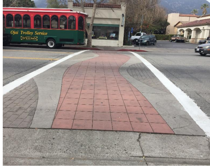
خط کشی در خیابان اصلی