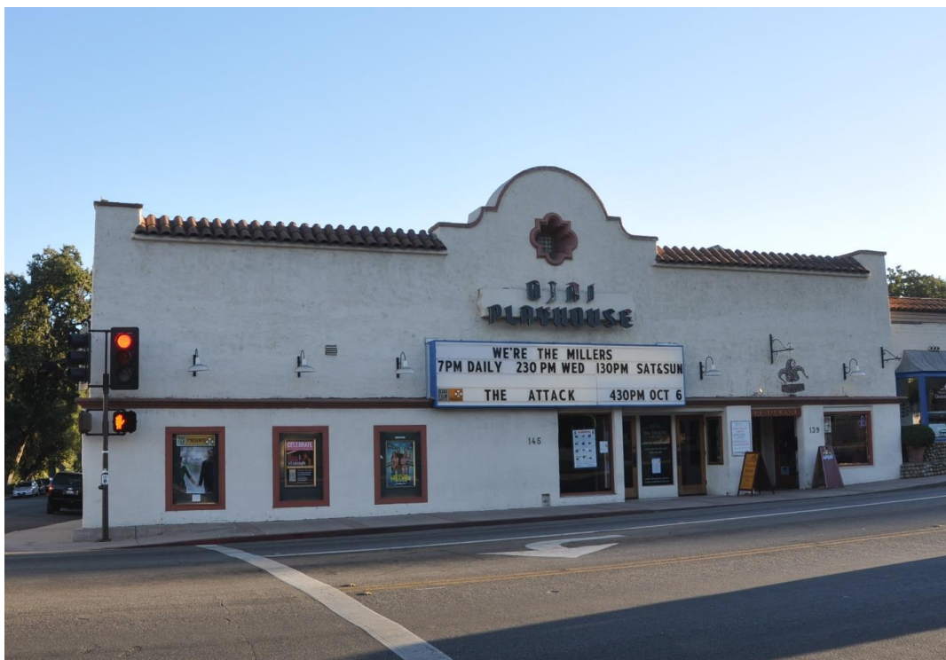
سالن نمایش اوهای 1914

لیبی، ریکوا (Requa) معماری از سن دیگو را برای طراحی شهر انتخاب کرد تا مرکز شهر با ترکیبی از معماری معاصر مستعمره ای اسپانیایی و معماری طاقی میسونری بازسازی شود. این مرکز جدید بصورت خطی در کنار خیابان اصلی شهر شکل گرفت با یک برج ساعت به تقلید از برج ساعت معروف کلیسای سن فرانسیسکو ای هاوانا و یک کلاه فرنگی در مقابل آن. در این بین شهر بار دیگر در سال 1917 به نام تاریخی خود یعنی اوهای بازگشت.