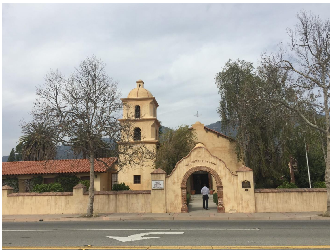
کلیسای سنت توماس اوهای ساخت 1918 طراحی ریکوا (به موزه تغییر کاربری داد)