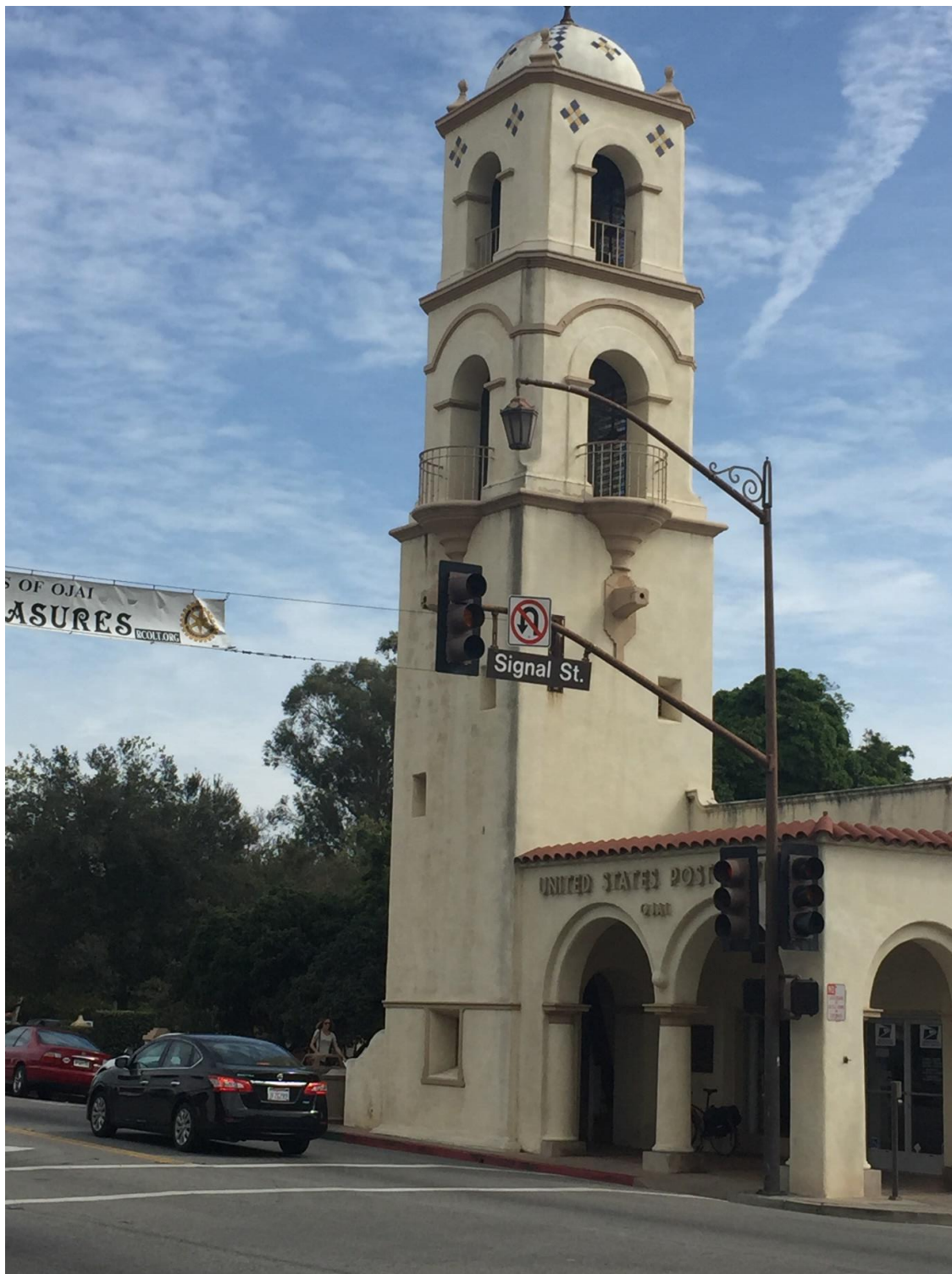
برج چهارطبقه ناقوس اوهای ساخت 1917 طراحی ریکوا

برج ناقوس و مرکز خرید طاقدار که همچنان باقی مانده اند، سمبلی از شهر بشمار می روند. اگرچه که مرکز خرید در سال 1971 صدمه دید و در سال 2000 بدنیا بازسازی مرکز شهر مرمت گشت. در سال 2002 یک پارک در این مرکز ساخته شد که گیاهان آن بومی کالیفرنیا بودند. علاوه بر آن بناهای اصلی دیگر مرکز شهر شامل دفتر پست، موزه، کتابخانه، سینما، مدرسه، کلیسا، فروشگاهها، و رستوران است.