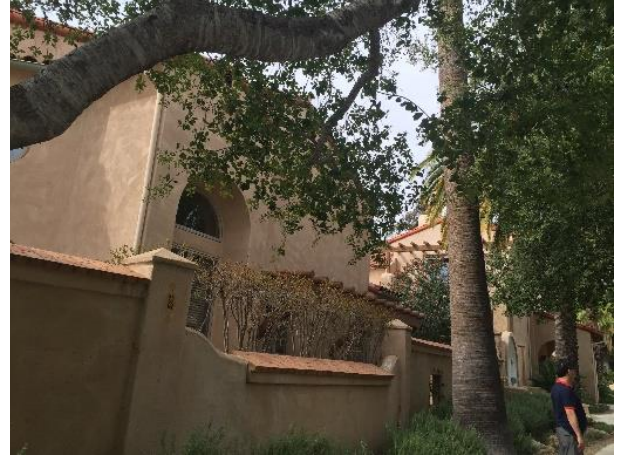
مجموعه مسکونی نوساز دراوهای