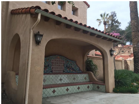
محل برای نشستن پیاده رو کنار خیابان