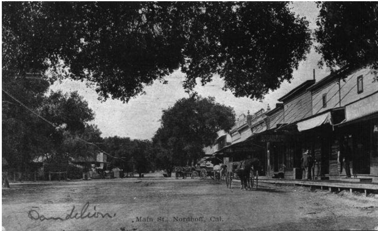
شهر نورداف سالهای 1917-1918