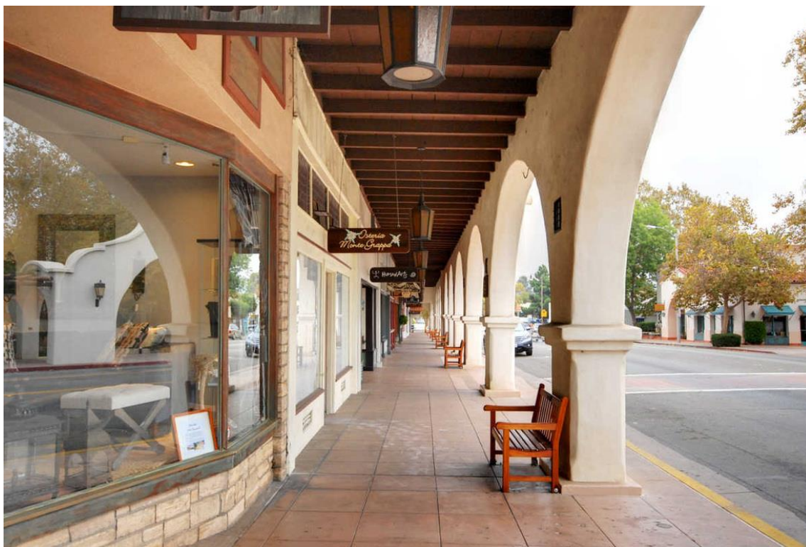
مرکز خرید تاریخی اوهای ساخت 1916 طراحی ریکوا