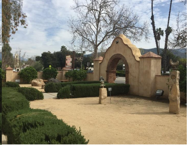
حیاط ورودی موزه و باغ مجسمه