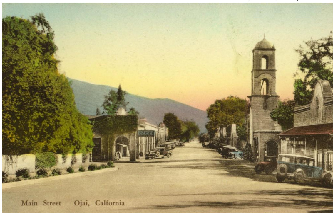
مرکز شهر اوهای در سال 1920

لیبی، ریکوا (Requa) معماری از سن دیگو را برای طراحی شهر انتخاب کرد تا مرکز شهر با ترکیبی از معماری معاصر مستعمره ای اسپانیایی و معماری طاقی میسونری بازسازی شود. این مرکز جدید بصورت خطی در کنار خیابان اصلی شهر شکل گرفت با یک برج ساعت به تقلید از برج ساعت معروف کلیسای سن فرانسیسکو ای هاوانا و یک کلاه فرنگی در مقابل آن. در این بین شهر بار دیگر در سال 1917 به نام تاریخی خود یعنی اوهای بازگشت.