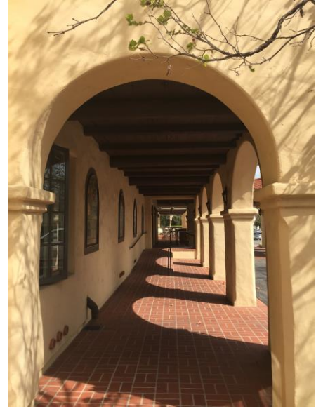
هتل چنارهای اوهای ساخت 1920 طراحی ریکوا

لیبی در سخنرانی که به مناسبت روز اوهای در هفتم آوریل 1917 داشت گفت: تنها هنر است که ایده آل ها را تجسم می کند و در همه جا و همه زمان ها ابراز شده است. از آغاز پیدایش بشر تا زمان حاضر ، هنر برای همه نژادها یکی از بزرگترین مشوق ها به سمت پیشرفت بوده است، پالاینده و مبلغ زیبایی برای مردم جهان."