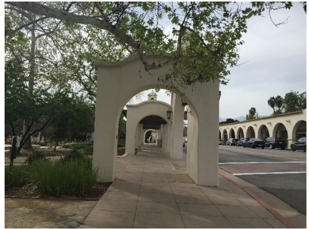
ورودی پارک لیبی