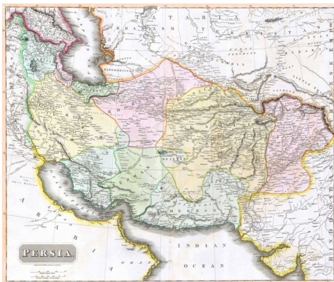
نقشه ایران در سال ۱۸۱۴ میلادی

نام کرمان از نام یکی از ده شاخه اصلی پارسیان که به جنوب ایران آمدند گرفته شده است. کرمان در زمان هخامنشیان بخش عظیمی از شهر (ساتراپی) فارس به شمار می رفت. از شهرهای کهن این سامان سیرجان (شیرگان باستان)، بردسیر، بافت (تپه یچی) (به اردشیر باستان)، گواشیر (کرمان امروزی)، فهرج (پهله باستان) و ارگ بم، نرماشیر، راین و جیرفت است.