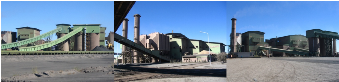
شرکت معدنی و صنعتی گل گهر

سنگ آهن از فراوان ترین مواد معدنی روی زمین و پرمصرف ترین مواد اولیه در جهان می باشد و ایران از نظر ذخایر قابل استخراج آهن در رتبه سوم آسیا و یازدهم جهان قرار دارد. ایران در سال، ۲۹ میلیون تن سنگ آهن تولید می نماید که از این میزان ۱۱ میلیون تن آن مربوط به منطقه گل گهر سیرجان می باشد. ناحیه معدنی سنگ آهن گل گهر در ۵۵ کیلومتری جنوب غربی شهر سیرجان واقع شده است و یکی از بزرگترین شرکت های تولید کنسانتره سنگ آهن و گندله در ایران می باشد. منطقه معدنی گل گهر با داشتن یک میلیارد تن ذخیره سنگ آهن ، ۴۵ درصد ذخایر سنگ آهن کشف شده در کشور را در خود جای داده است.