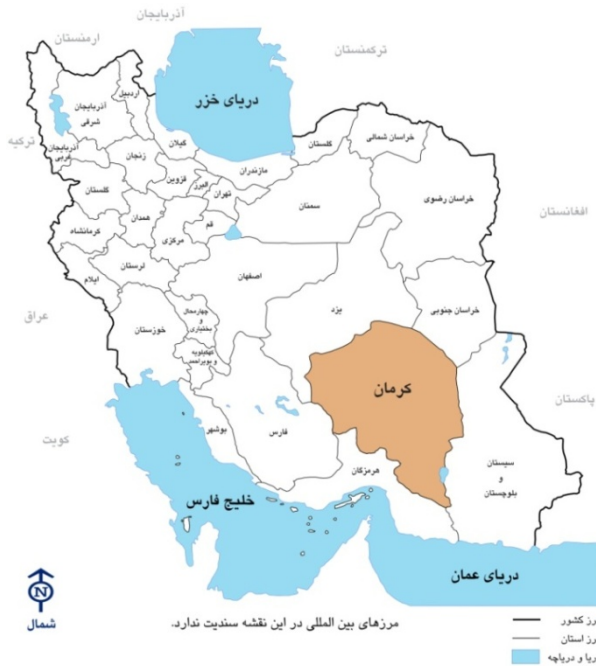
موقعیت استان کرمان در نقشه سیاسی ایران

استان کرمان در جنوب شرقی ایران فلات مرکزی و بین ۵۳ درجه و ۲۶ دقیقه تا ۵۹ درجه و ۲۹ دقیقه طول شرقی و ۲۵ درجه و ۵۵ دقیقه تا ۳۲ درجه عرض شمالی قرار دارد. این استان از شمال با استان های خراسان جنوبی و یزد، از جنوب با استان هرمزگان، از شرق با استان سیستان و بلوچستان و از غرب با استان فارس همسایه است. این استان با مساحتی در حدود ۱۷۵۰۶۹ کیلومتر مربع، اولین استان پهناور کشور می باشد که در حدود ۱۱ درصد از خاک ایران را در بر گرفته است. براساس آخرین تقسیمات کشوری، استان کرمان دارای ۲۰