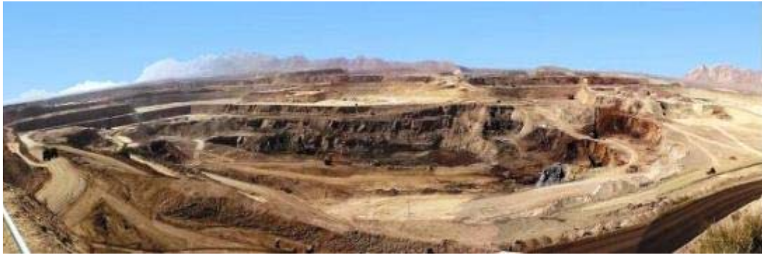
معدن گل گهر

راه ارتباطی این ناحیه، جاده فرعی اختصاصی مجتمع است که از کیلومتر ۵۰ جاده سیرجان - شیراز منشعب می شود. مجتمع صنعتی - معدنی گل گهر همچنین از طریق یک انشعاب از راه آهن سراسری تهران بندرعباس ، با شبکه ی سراسری راه آهن مرتبط است.