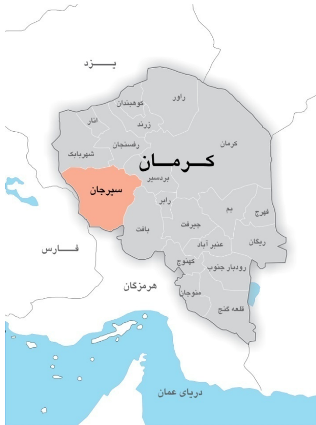
موقعیت شش شهرستان سیرجان در استان کرمان

در زمینه کشاورزی نیز این استان جزو استان‌های تاثیرگذار ایران می‌باشد، بیش از ۴۰٪ باغهای کشور در این استان قرار دارد و نقش اساسی در تامین محصولات زراعی و خودکفایی در تولید گندم در سال ۸۸ داشته‌است. پسته، گردو، سیب درختی، عسل، زیره، گل محمدی و گلاب، خرما، مرکبات، محصولات جالیزی، پنبه، ذرت و... از سایر محصولات کشاورزی مهم استان می‌باشد. استان کرمان همچنین، بزرگترین تولیدکننده پسته جهان است. امروزه با توسعه همه‌جانبه و سرمایه‌گذاری‌های عمرانی و اقتصادی و به‌خصوص ایجاد منطقه آزاد سیرجان، ارگ جدید بم، راه آهن بافت و پیوستن خط راه‌آهن سراسری کشور و امتداد آن تا آب‌های خلیج فارس و تأسیس فرودگاه جدید رفسنجان و ده‌ها پروژه دیگر، سیمای استان کاملاً دگرگون شده و به یکی از استان‌های مهم کشور تبدیل شده‌است. در سند توسعه این استان برای رسیدن به عنوان سومین استان توسعه‌یافته کشور پس از تهران و اصفهان برنامه‌های قابل توجهی در حال اجراست که در صورت تامین منابع مالی مناسب تا سال ۱۳۹۵ محقق خواهد شد.